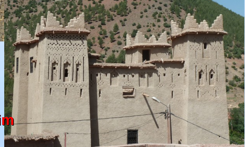
Casbah Ait Oukdim