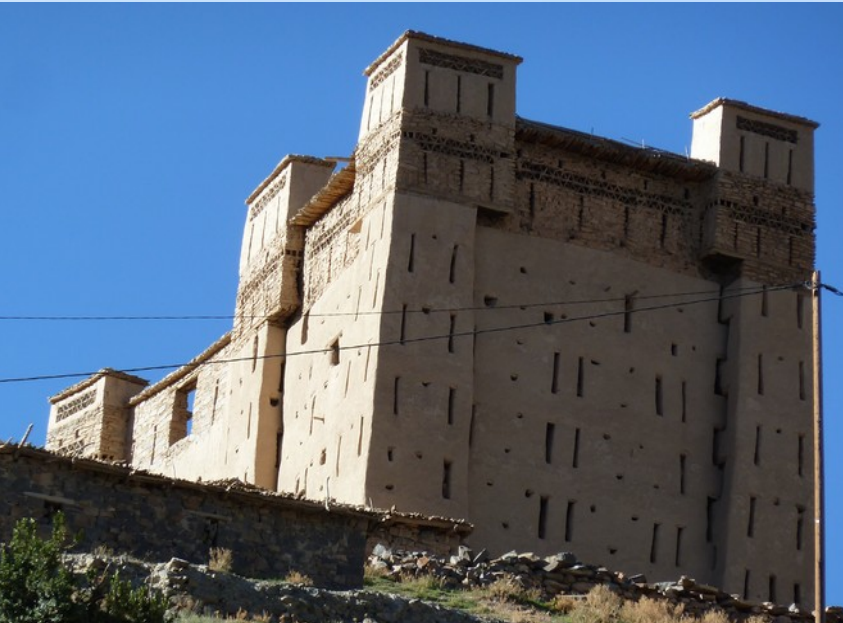
Grenier d' Amezray le haut