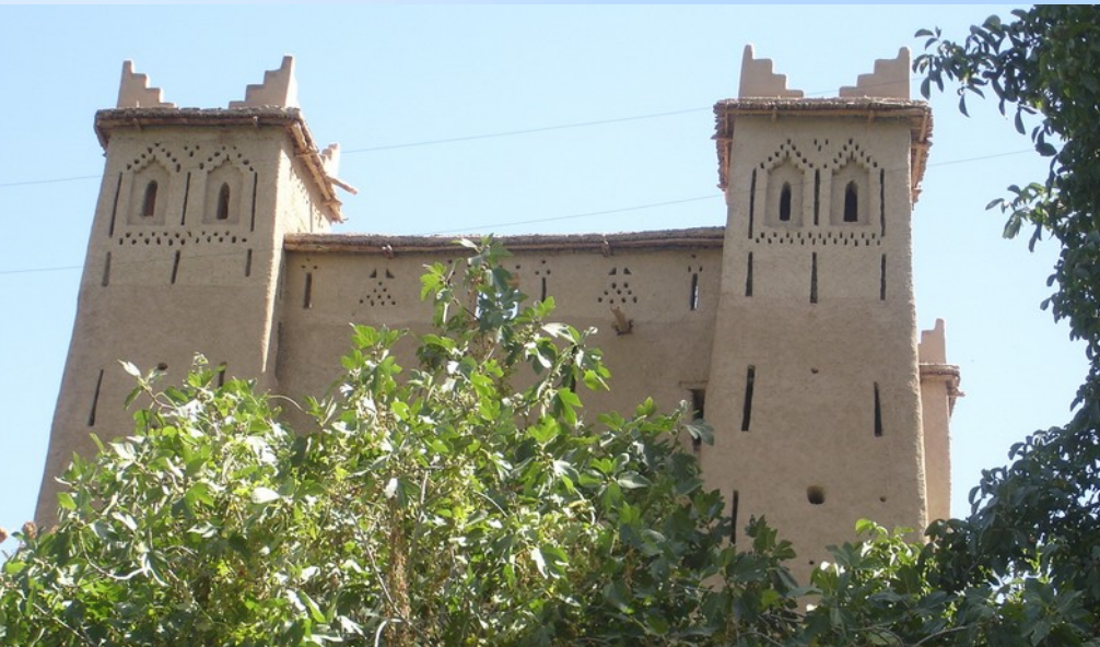
Casbah « d'Abdoulah »