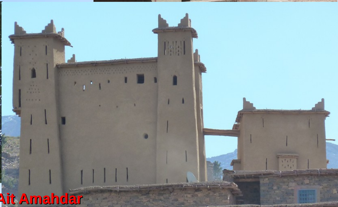
Casbah Ait Amahdar