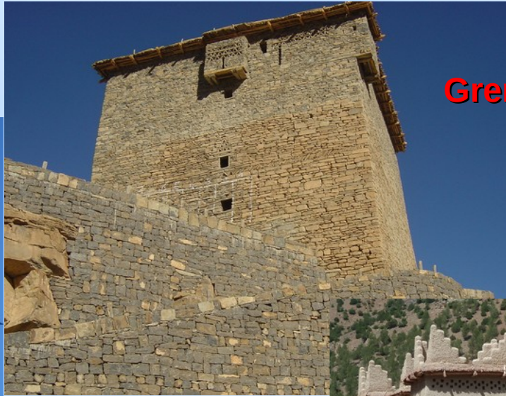
Grenier d'Amezray Le Bas