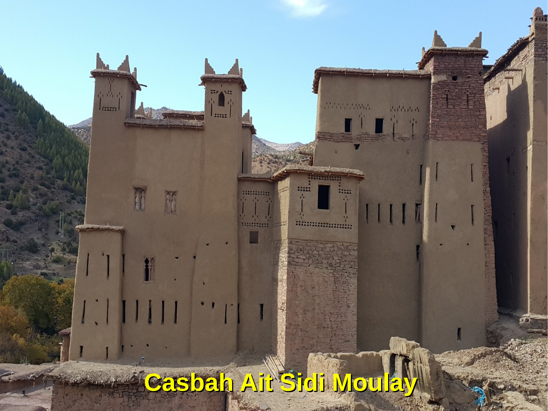
Casbah Ait Sidi Moulay